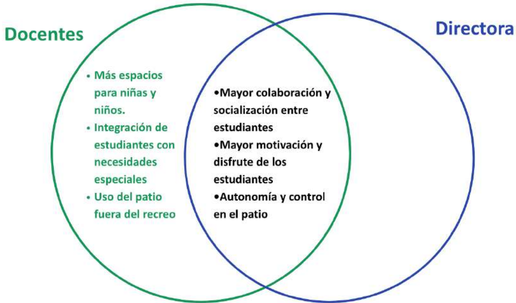
Gráfico 8: Principales cambios en el comportamiento de estudiantes con el nuevo patio, identificados por los docentes y directora

Los docentes y la directora coinciden en que hay tres cambios en el comportamiento de los estudiantes que se describen a continuación.