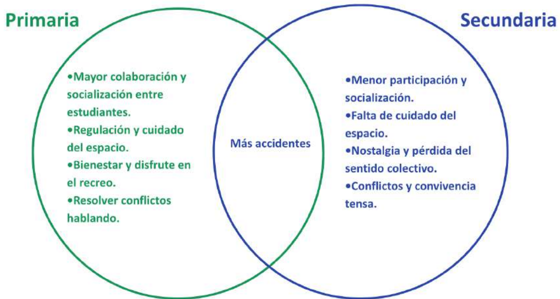
Gráfico 7: Principales cambios en el comportamiento con el nuevo patio, identificados por estudiantes

Los estudiantes de primaria mencionaron los siguientes cambios: